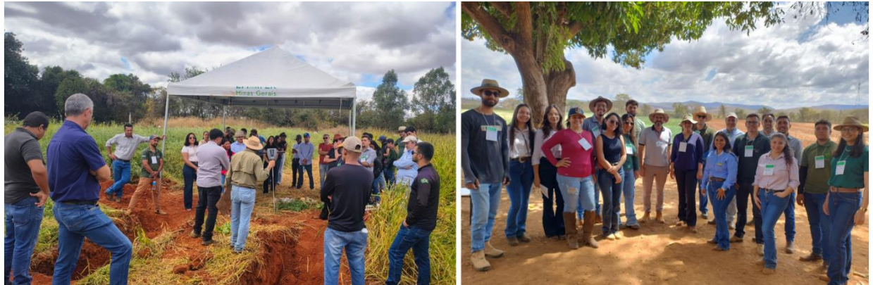
Figura 4. Atividade de Extensão – dia de campo sobre plantas de cobertura em rotação ao cultivo de milho-silagem. Agosto de 2025, Fazenda Experimental do ICA/UFMG, Montes Claros-MG.