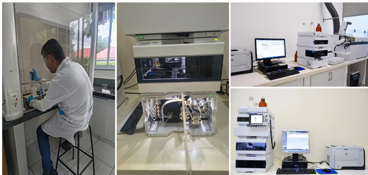
Figura 2. Estrutura do Laboratório de Química instrumental do ICA/UFMG usada em análises de herbicidas e de compostos em plantas, Montes Claros–MG.