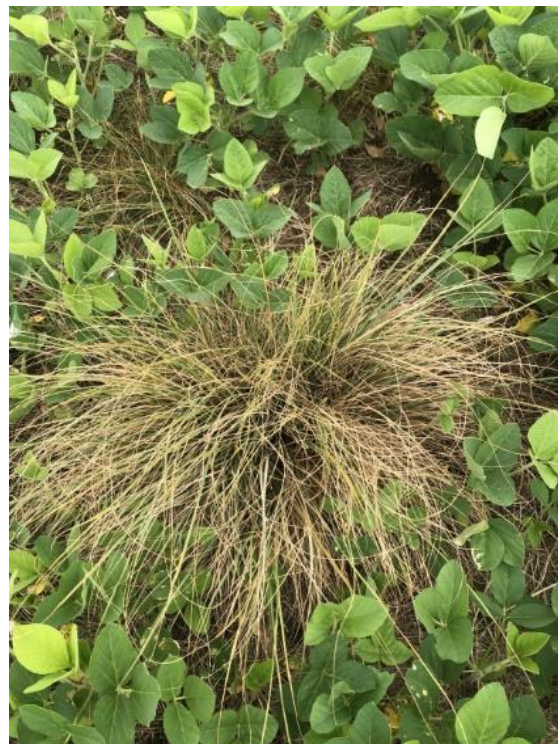
Figura 11. Planta de capim-annoni sobrevivente à aplicação de glyphosate em sistema de integração lavoura-pecuária, com soja no verão e azevém no inverno. São Gabriel-RS, 2020.

de estratégias de manejo para o controle da invasora.