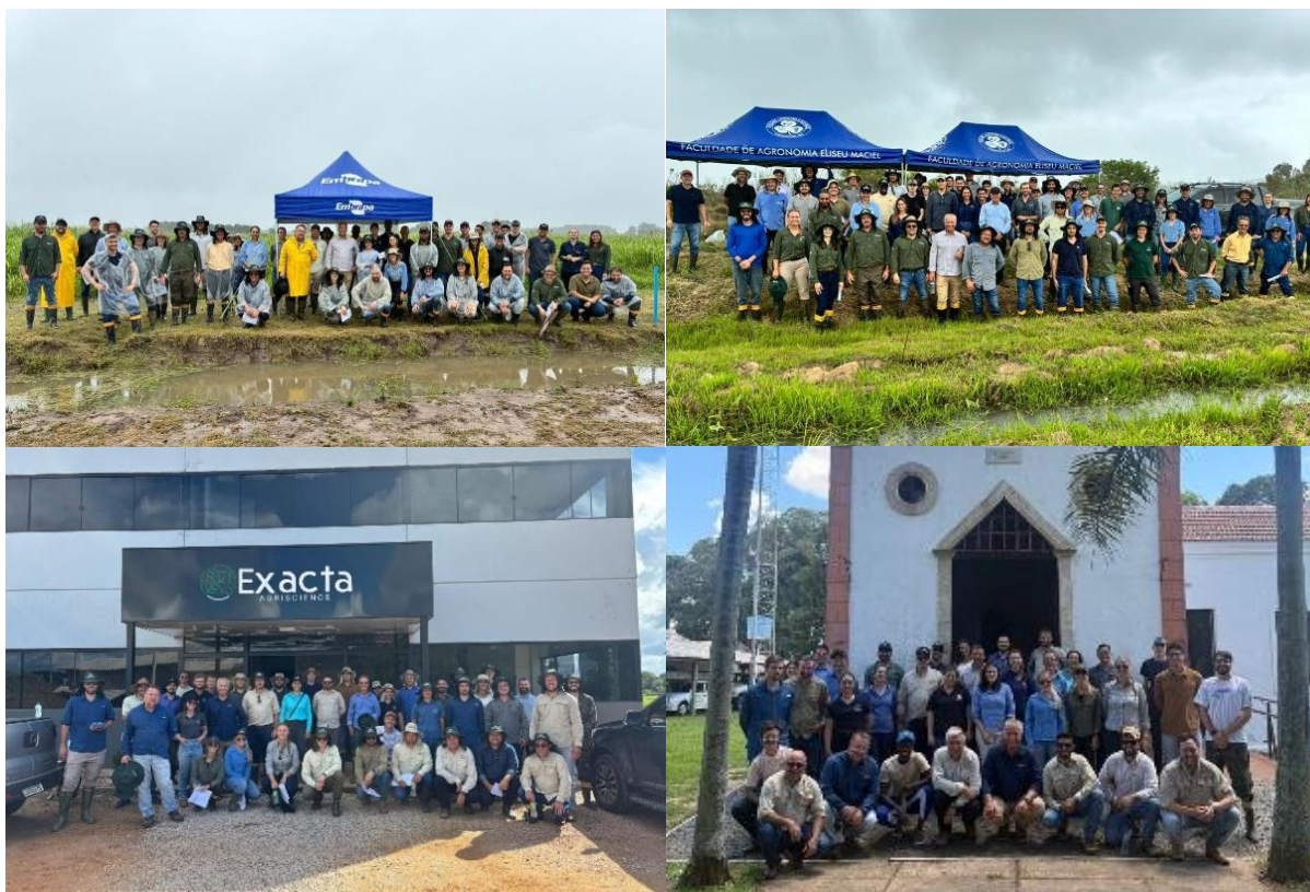
Figura 7. Embrapa Clima Temperado (superior esquerda), UFPEL (superior direita), Exacta Agriscience (inferior esquerda) e UFRGS (inferior direita) na XXX Jornada e VIII Campeonato de Herbologia do Rio Grande do Sul, 2026.