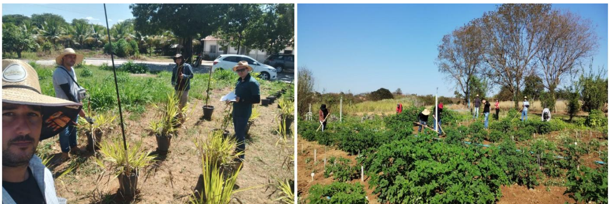
Figura 5. Atividades do grupo de plantas daninhas da UFMG, Montes Claros-MG.