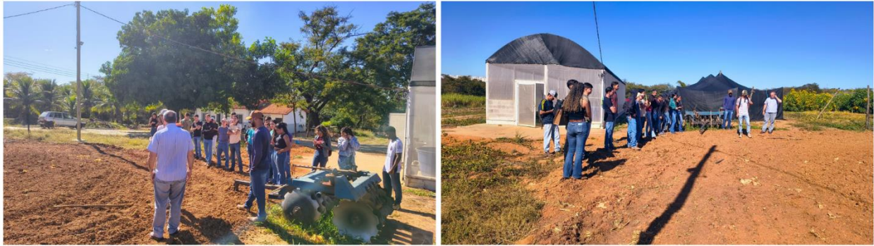
Figura 3. Atividades de aula de plantas daninhas na UFMG, Montes Claros–MG.