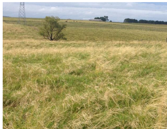
Figura 10. Área infestada por capim-annoni. Bagé-RS.

No Pampa, nos campos destinados à pecuária de corte, a falta de manejo adequado com pastejos excessivos, favorece a disseminação e o estabelecimento do capim-annoni. Estima-se que mais de 10% do bioma, que ocupa 60% da área do Rio Grande do Sul (RS), esteja ocupado pela invasora. Após sua instalação, o capim-annoni promove a supressão da biodiversidade local,