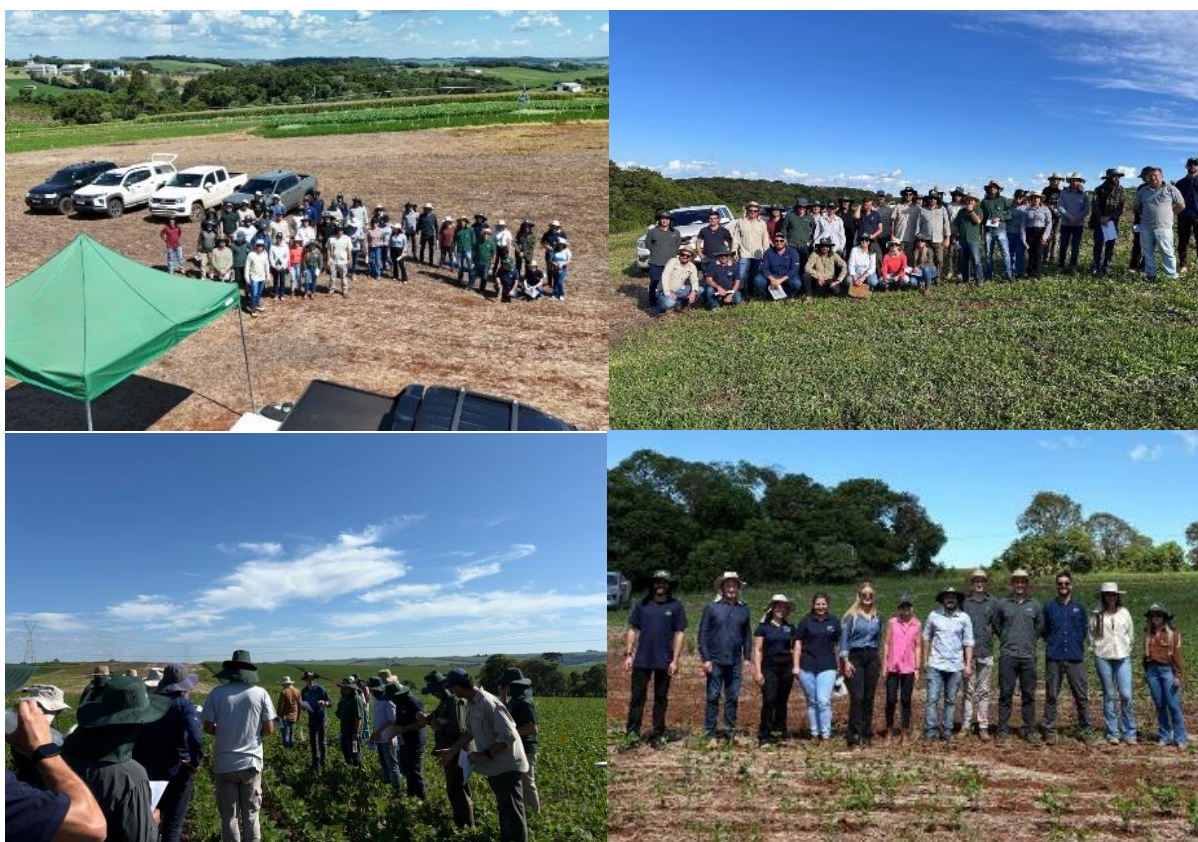
Figura 8. UFFS (superior esquerda), IFRS (superior direita), UPF/Up.Herb (inferior esquerda) na XXX Jornada e VIII Campeonato de Herbologia do Rio Grande do Sul, 2026 e VIII Campeonato de Herbologia do RS (inferior direita).