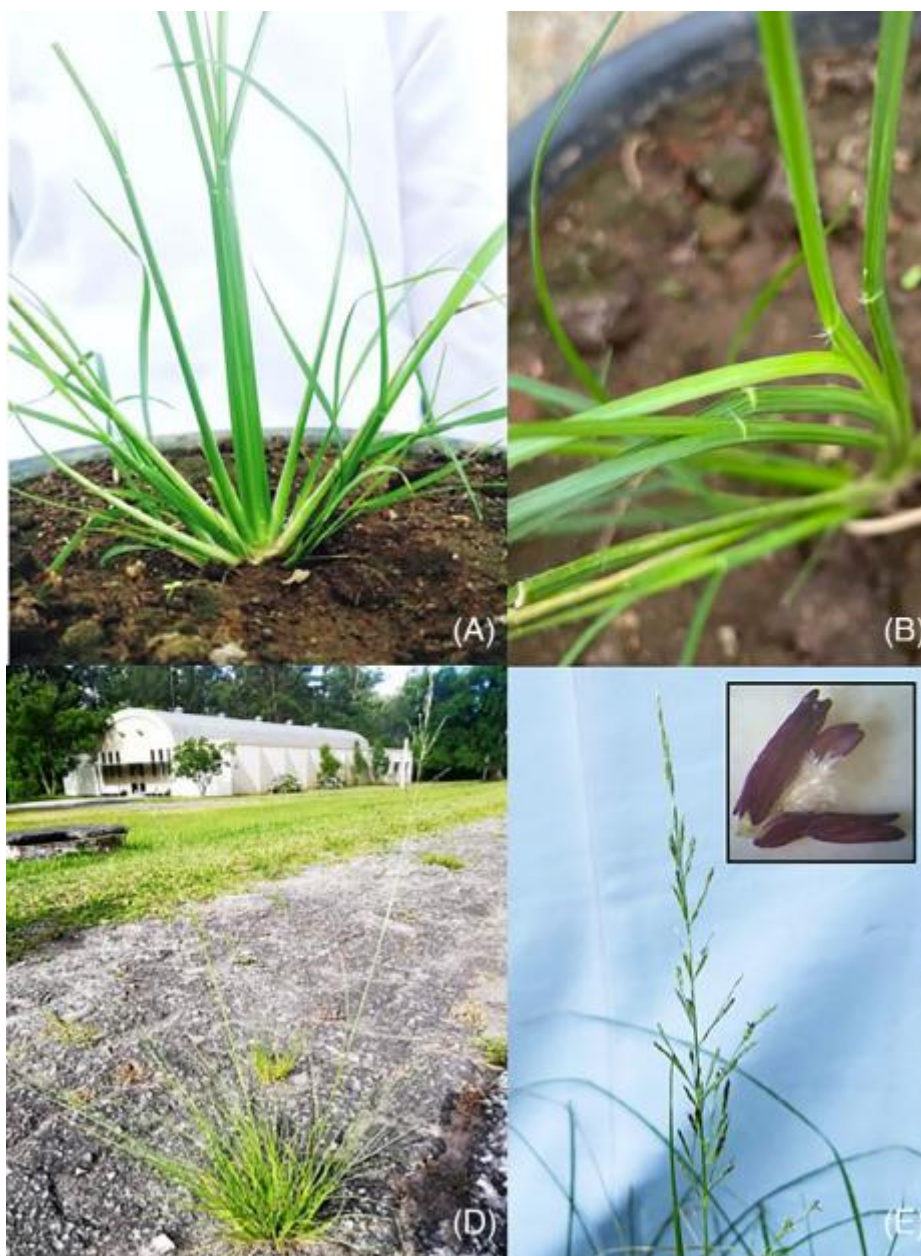
Figura 12. (A) Base do colmo achatada, (B) lígula ciliada, (D) planta em crescimento na estrada e (E) panículas com espiguetas.

Pastagens infestadas com capim-annoni podem produzir, em média, de 44 a 78 kg de carne \text{ha}^{-1} \text{ano}^{-1} ; todavia, com a adoção do MIRAPASTO, a produção pode chegar a 400-500 kg \text{ha}^{-1} \text{ano}^{-1} . O cuidado para que novas sementes não sejam reintroduzidas na área por animais provenientes de áreas infestadas é fundamental; uma quarentena de pelo menos 3 dias, permite eliminar a maior parte das sementes no trato