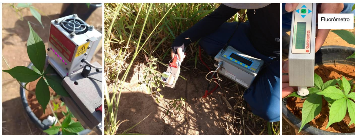
Figura 1. Avaliação da ecofisiologia de plantas daninhas com IRGA e Fluorômetro nas dependências do Laboratório de Plantas Daninhas do ICA/UFMG, Montes Claros–MG.

Atenção! Entre em contato conosco pelo e-mail boletim.sbcpd@gmail.com para divulgar também o seu grupo de pesquisa na área de plantas daninhas!